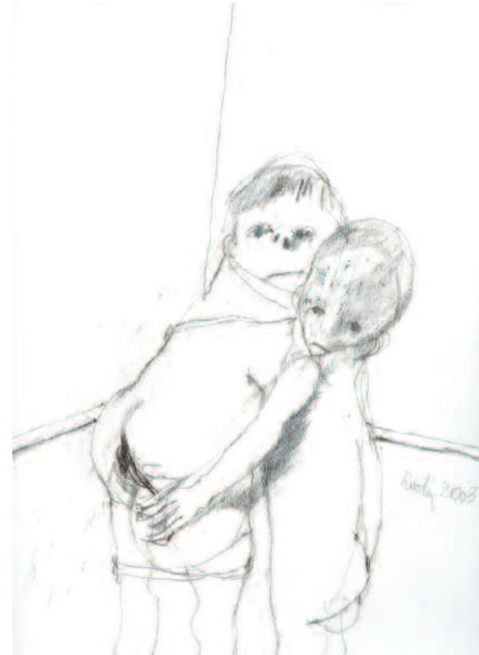
Sans titre , crayon sur papier 24 x 32 cm, 2003