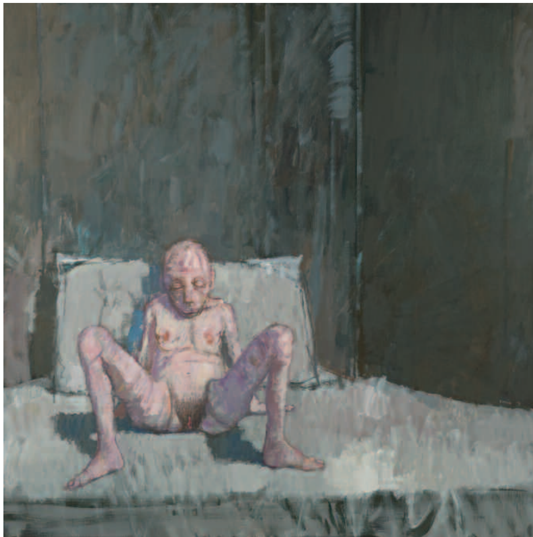
Le repos , acrylique sur toile, 150 x 150 cm, 1995