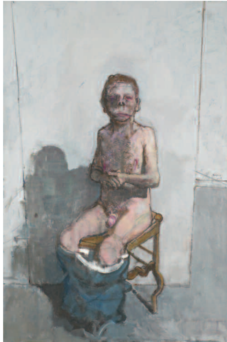
Sur la chaise du salon , acrylique sur toile, 195 x 130 cm, 1991