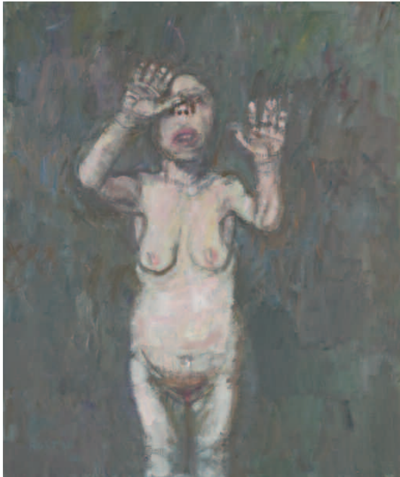
Le cri , acrylique sur toile, 65 x 54 cm, 1999