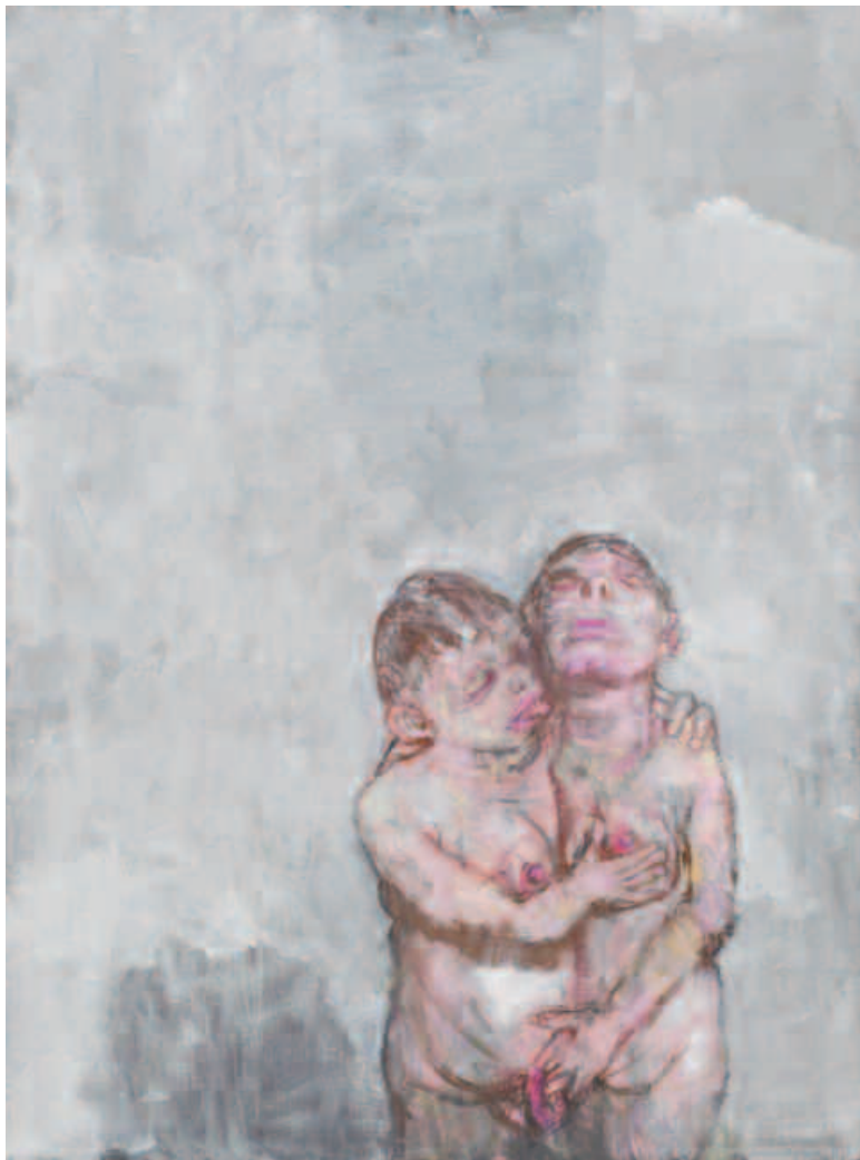
Les copines , acrylique sur toile, 130 x 97 cm, 2006