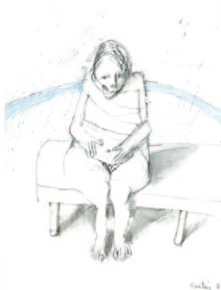
Sans titre , technique mixte sur papier, 24 x 32 cm, 2001