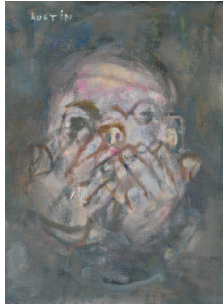
Portrait , acrylique sur toile, 33 x 24 cm, 2009