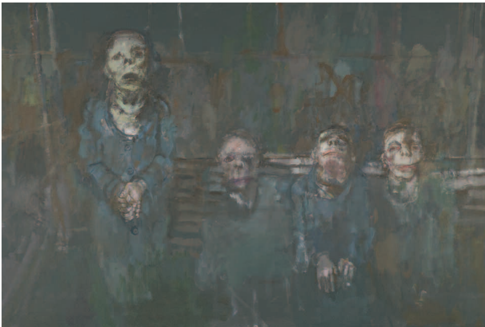
Les pensionnaires , acrylique sur toile, 130 x 195 cm, 2003