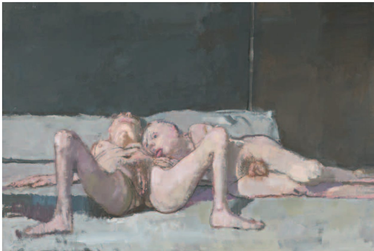
Le soir , acrylique sur toile, 130 x 195 cm, 1998

Vernissage le samedi 22 janvier de 15h à 19h